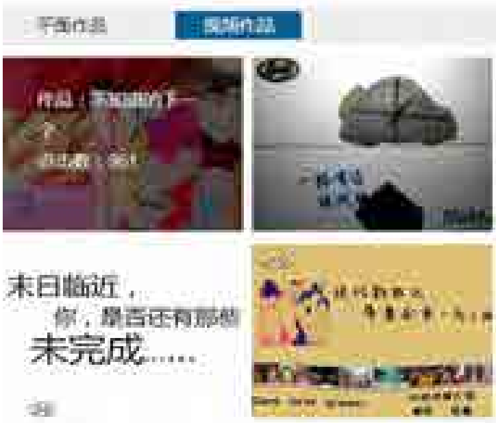
部分视频作品展示

11 月 5 日至 11 月 20 日，接受 60 强作品深化上传，进行作品展示，接受网络投票。