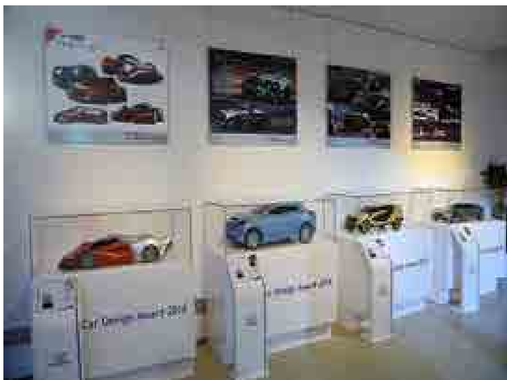
部分实体车模作品展示

决赛阶段，由大赛专业评审在入围的 30 强中评选出了一等奖 1 名、二等奖 2 名、三等奖 3 名以及优秀奖 6 名，获奖者获得了不同金额的现金奖励。