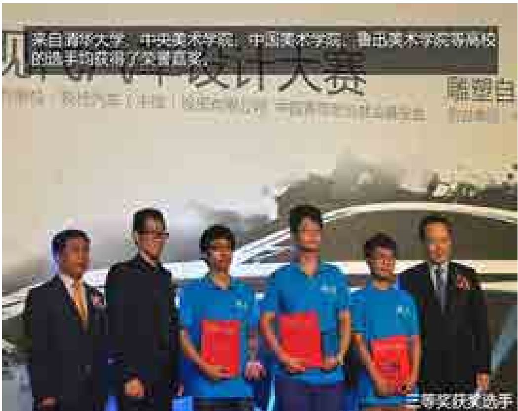
2014年7月27日至8月3日，获得“2014现代汽车设计大赛”全国30强荣誉的学子们在现代汽车工作人员的陪同之下，赴韩国进行设计研修、参观交流