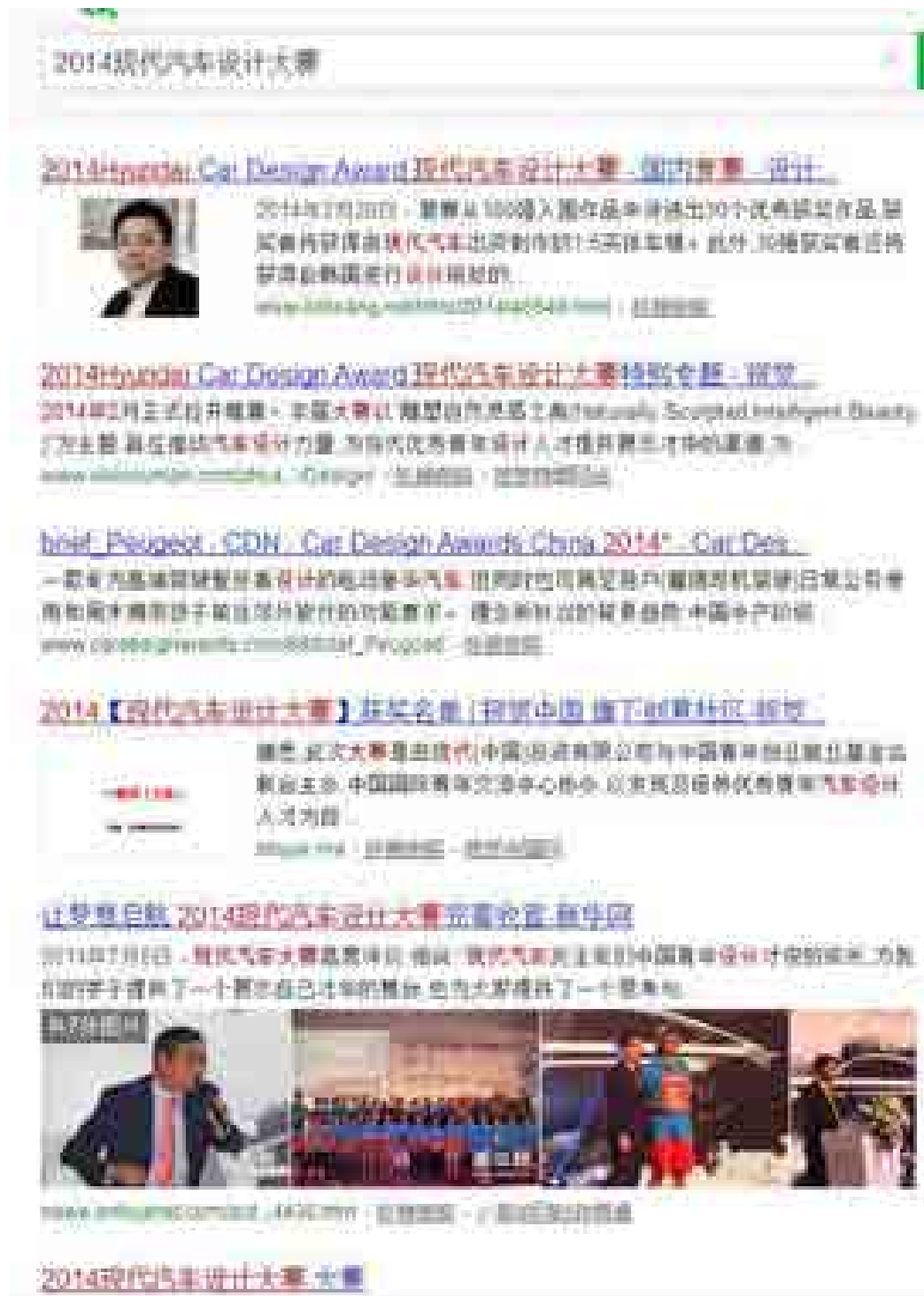
2014 年现代汽车设计大赛