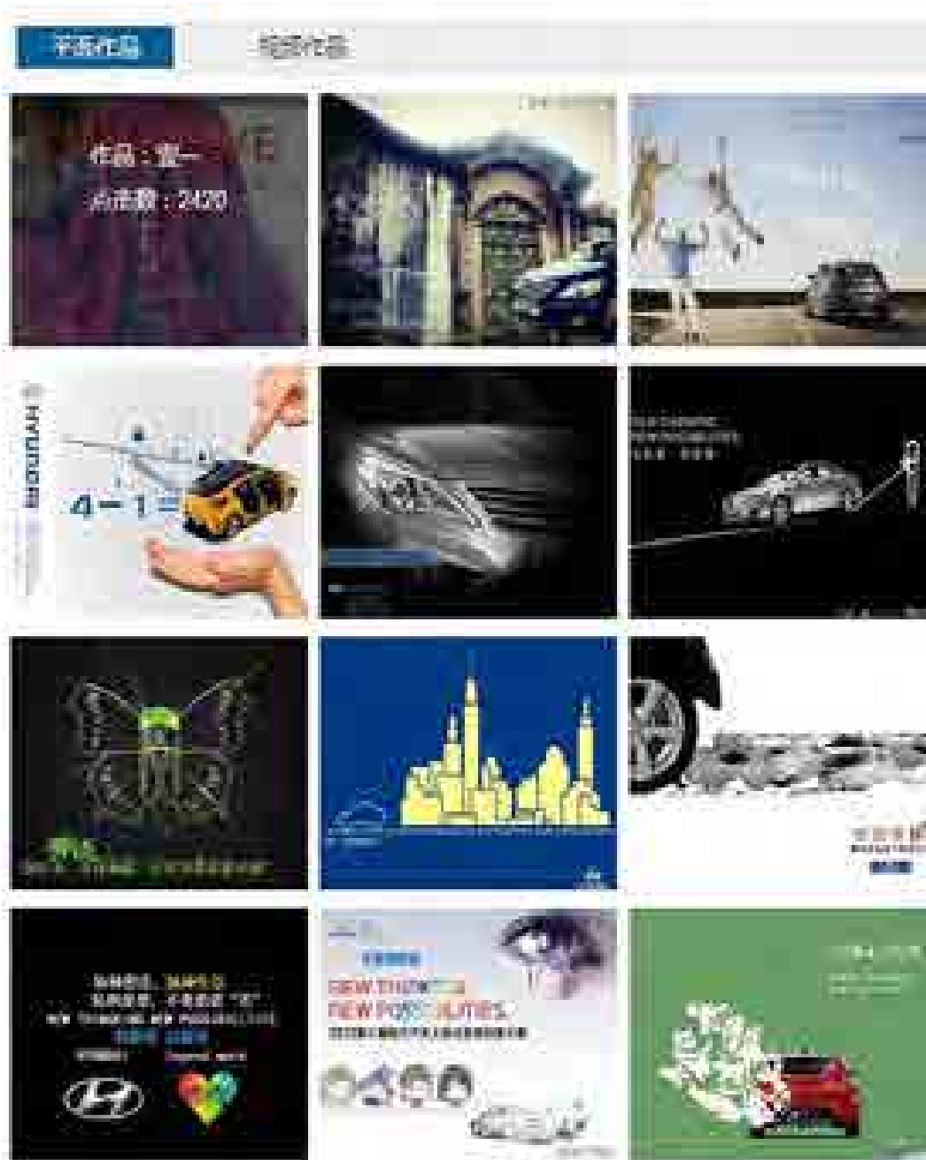
部分平面作品展示

11月21日至11月22日，公布了10强作品名单，平面广告6组，视频广告4组。随后，10强作品深化上。