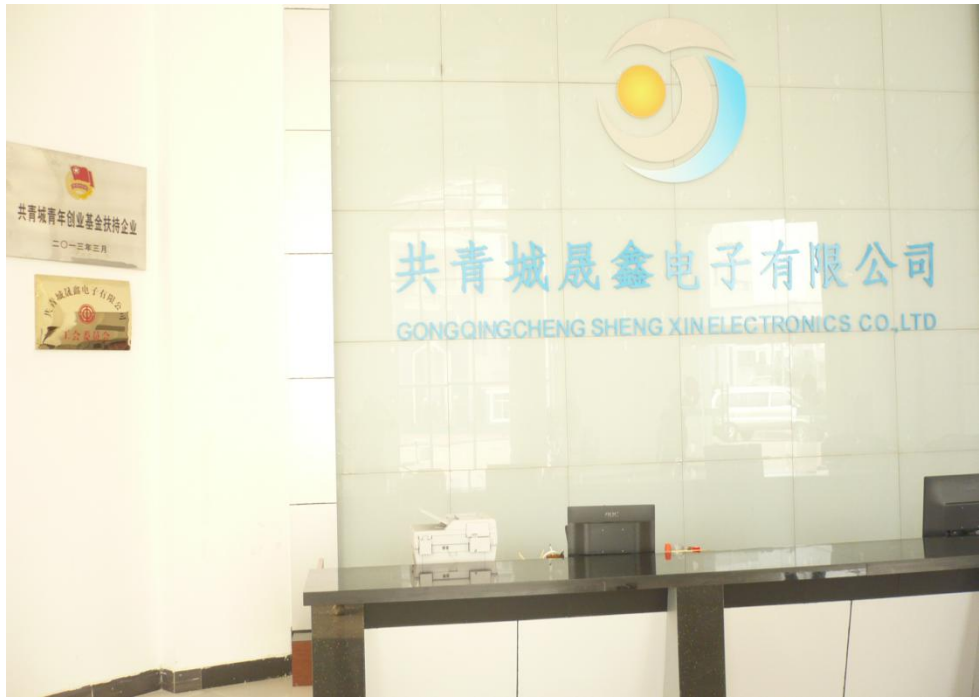
共青城创业基金扶持企业之一