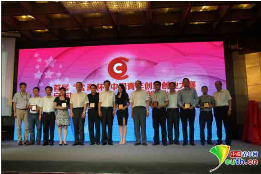
大赛评审委员会代表合影