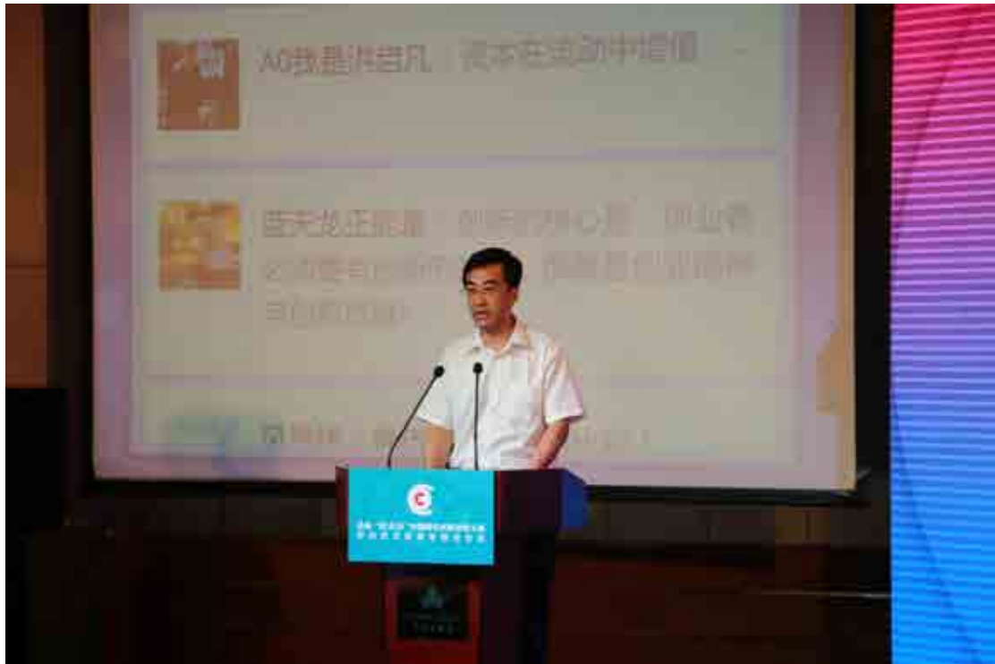
团中央书记处第一书记秦宜智在启动仪式上发表重要讲话