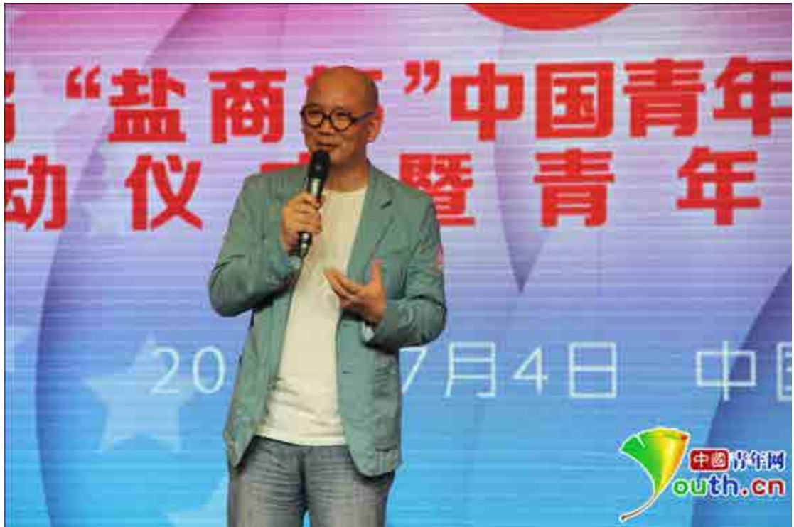
大赛启动仪式后开始的青年创业论坛中国青年网记者刘畅摄