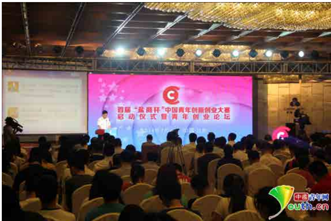
首届“盐商杯”中国创新创业大赛启动仪式现场