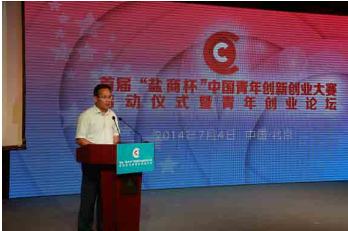
团中央书记处书记徐晓介绍大赛情况