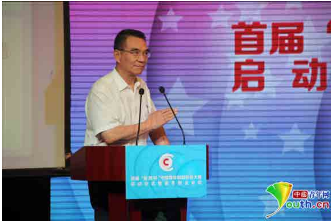
全国工商联副主席林毅夫在启动仪式上讲话