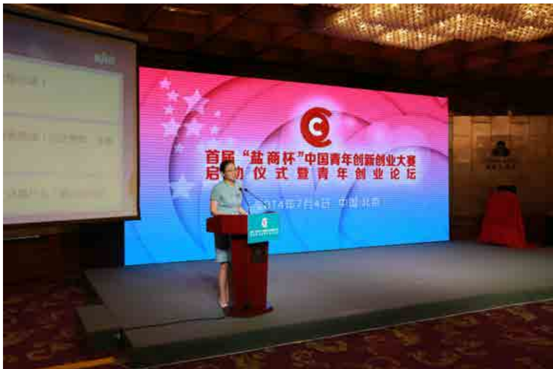
团中央书记处书记汪鸿雁主持大赛启动仪式