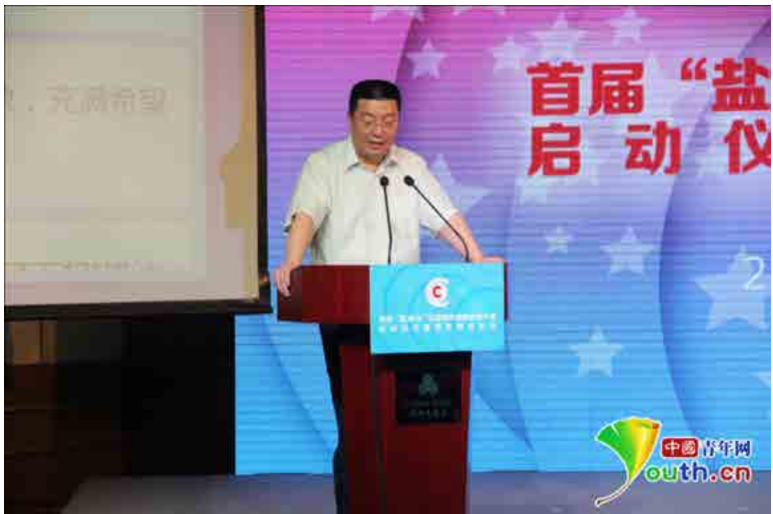
分众传媒创始人江南春在青年创业论坛发言