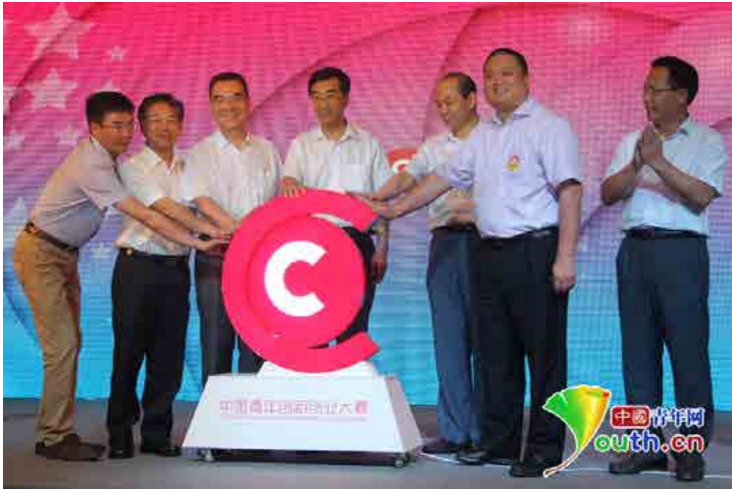
大赛 LOGO 点亮的瞬间